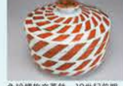
色絵螺旋文蓋鉢 19世紀前期

古伊万里は、約400年前に肥前有田(現：佐賀県西松浦郡有田町)で生み出された日本初の磁器です。19世紀に入ると、それまで上層階級に限られていた磁器の使用が、都市部を中心に庶民層にも広がりをみせます。一方、上方の庶民から生まれたくろ元禄文化は、19世紀に入ると江戸の町にも普及しました。歌舞伎や浮世絵など、自由で華やかな庶民文化が流行し、人々は「粋な」江戸文化を謳歌したのです。日本料理の基礎ができたといわれるこの時代には、食文化も豊かになり、日常器だけではなく宴をいろうる粋な器が使われました。本展では、初公開の古伊万里コレクションを通じて、江戸の人々が好んだ「粋な古伊万里」に注目し、その驚くべき意匠(デザイン)の世界を探ります。