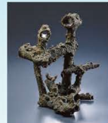
熊倉順吉「作品」1950年代後半

ジャズ・スピリットを感じて… 熊倉順吉の陶芸×21世紀の陶芸家たち展 平成30年3月10日(土)～6月17日(日)