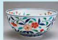
色絵花唐草文鉢 18世紀前期

いきこいまり 粹な古伊万里ー江戸好みのうつわデザイン 平成29年10月1日(日)～12月17日(日)