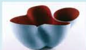
イレネ・フォンク 「キュラソー・コレクション」1997 岐阜県現代陶芸美術館蔵

特別企画 “うつわ”ドラマチック展 平成29年3月11日(土)～6月11日(日)