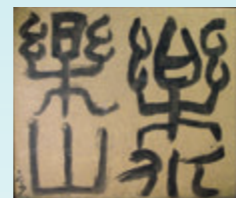
北大路魯山人 書「樂山樂水」 1925～1939年 個人蔵

《入場料》 一般 700円(560円)、高大生 500円(400円) 中学生以下無料 * ( )内は20人以上の団体料金 《ギャラリートーク》 10/28(日)、11/11(日) 各日とも13:30～