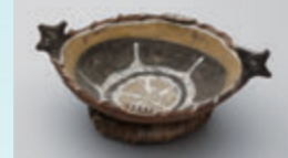
バブアニューギニア アイボム村 「皿」1990年頃

《入場料》 一般 500円(400円)、高大生 380円(300円) 中学生以下無料 * ( )内は20人以上の団体料金 《ギャラリートーク》 8/12(日)、9/23(日) 各日とも13:30～