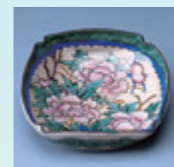
湖東焼「色絵牡丹図鉢」 江戸時代後期制作

季節は春。花いっぱいの展覧会を開催します。花は、古来より様々な芸術のジャンルにおいて表現されてきました。やきもの例外ではなく、東洋陶磁においては華やかな花を意匠化した伝統文様が器を彩ります。また現代陶芸においても、植物が持つ強い生命力、美しさ、清々しさにインスピレーションを受ける作家は多く、それぞれの思いをもって表現をおこなっているのです。本展では、「花」を入口に、様々な時代の陶による表現の世界を探ります。