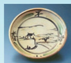
富本憲吉 「土焼鉄描銅彩大和風景大皿」 1929年制作 個人蔵

中世古窯以来の伝統を誇り、焼締め陶をはじめ多彩なやきもの文化が育まれてきた陶郷・信楽。近代陶芸の巨匠・富本憲吉、現代陶芸の開拓者として活躍した八木一夫や熊倉順吉、また絵画や彫刻の世界で活躍した岡本太郎など。長年人々の生活を支えてきた歴史や技術への興味や関心から、この地を訪れた作家も少なくありません。彼らはどのような経緯で信楽を訪れ、どのような仕事を手掛けてきたのでしょうか。本展では、そうした作家たちの取り組みをたどりながら、信楽のやきもの新たな魅力を探ります。