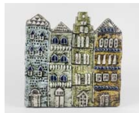
リサ・ラーソン「旧市街」製造 1963-1978 グスタフスベリ磁器工房 個人蔵