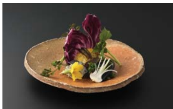
杉本真光「信楽火色丸皿」c.1999 個人蔵 料理：陶の辺料理 魚仙

シリーズ・やきもの×グルメⅠ ーシェフイチ推しの、Shigaraki Styleー