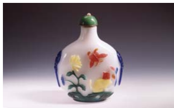
「白地多彩猫花蝶文鳥壺壺」 中国ガラス 18-20世紀

日本屈指の東南アジア陶磁コレクションで知られる、町田市立博物館(現在休館中)の陶磁器やガラス工芸の優品約130点を厳選して展示します。多彩な作品を通じて、魅力に溢れたアジア工芸の世界をお楽しみいただけます。