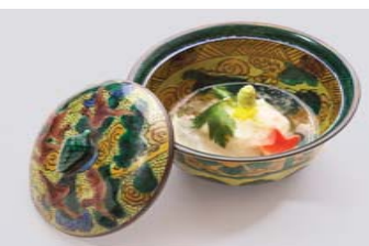
湖東焼「色絵雲鶴文蓋付向付」19C前半 個人蔵 料理：井口幸恵