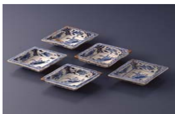
湖東焼「染付蓮水禽文変形向付」 19C前半

湖国近江では湖と山野の幸を活かした、地域性豊かな料理文化が育まれてきました。本展では、近江の古陶磁を「観て・使って・味わう」をテーマに、ユネスコ無形文化遺産に登録された和食文化、湖国の郷土料理との競演を試みます。