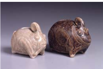
「灰釉兎形壺」「黒釉兎形壺」 クメール陶器 12-13世紀