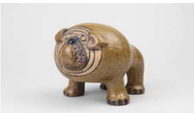
リサ・ラーソン「ブルドッグ/ケンネルシリーズ」 製造 1972-1987 グスタフスベリ磁器工房 リサ・ラーソン蔵

動物や人物をモチーフとし温かみのある作品で世界中の人々を魅了するリサ・ラーソン。「Seen and Unseen」をテーマに、お馴染みの名作とスウェーデンの旧市街の家屋や未知なる動物など、リサ・ラーソンの知られざる創造の世界を紹介します。